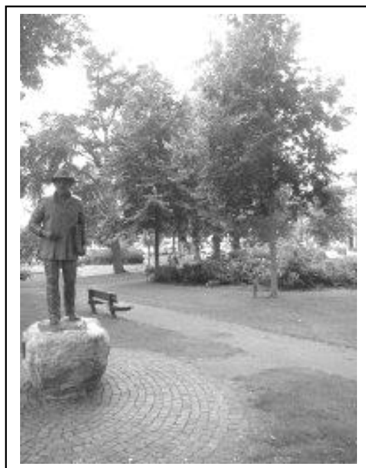
Nuenen Park: Vincent van Gogh