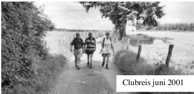
Clubreis juni 2001

Toon van Wordragen is meestal bereikbaar op ☎ 0495-537775. Mogelijk krijgt u het antwoordapparaat.